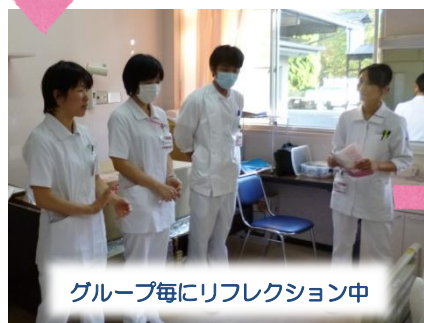
グループ毎にリフレクション中