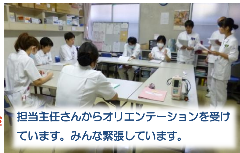
担当主任さんからオリエンテーションを受けています。みんな緊張しています。