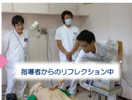
指導者からのリフレクション中

1回目のリフレクションを活かしてもう1回やってみましょう！ 2回することで1回目の学びを定着させる効果があります。