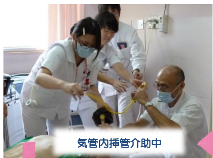
気管内挿管介助中