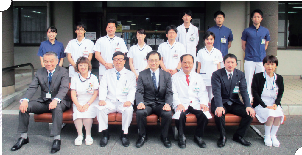
2019年4月1日に当会の入会式を執り行いました。